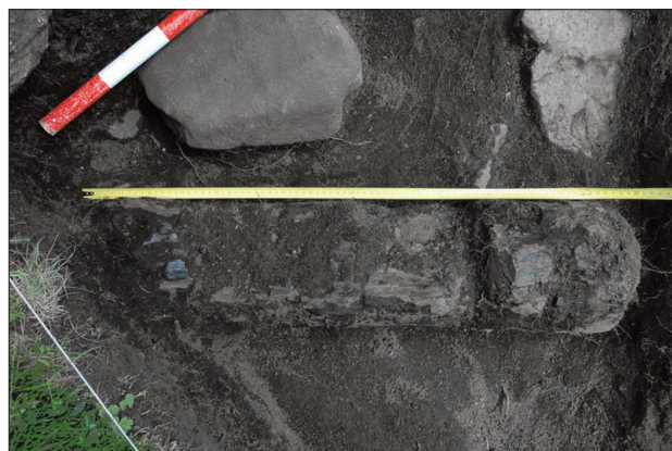
Fig. 2. Detalle de la estaca i poste recuperado en el interior de la munyidora ES 201.

El poste o estaca medio carbonizado localizado en la UE 201102 tiene 70 cm. de longitud por 17 cm. de anchura. De hecho, sólo está carbonizada la parte exterior de la pieza. Este poste presenta trazas de uso de un golpe de hacha y una hendidura que parece haberse utilizado para unir el poste con una cuerda. La parte que debió corresponder a la cuerda muestra una superficie lisa y un poco más brillante que el resto si lo observamos a través de la lupa. La pieza presenta una sección circular. La técnica de construcción de la misma fue la obtención de un tronco de unos 24 cm. de diámetro al que se le arrancaron las pequeñas ramas que le salían por los costados. En concreto, hemos observado tres inicios de ramas. La parte que estaba en contacto con el suelo es madera y muestra alteraciones postdeposicionales.