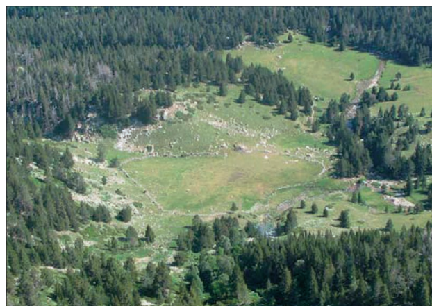
Fig. 1. Vista general del yacimiento de Pleta de l'Estall Serrer.

En este trabajo presentamos tres estructuras modernas fechadas por radiocarbono en el siglo XVIII, en el que hemos documentado un elemento en común: todas ellas presentan niveles de destrucción de la estructura debido a su incendio. Se trata de una munyidora o corredor para ordeñar ganado (ES 201) y dos cabañas pastoriles (ES 209 y 211). En dos de las estructuras se recogie-