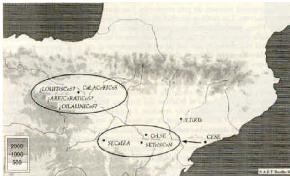
Fig. 2. Primeras emisiones monetales en el valle medio del Ebro

Si bien existen discrepancias en iniciar las emisiones con las denominadas series de «la leona» que llevan la insignia de azor inclinada 22 o con las que la llevan la insignia al hombro 23 o bien las de la leyenda Secaizacom 24 . La primera de estas propuestas, realizada por Villaronga y a la que se suma Gomis, es la más convincente al apoyarse en un análisis metrológico e iconográfico contextualizado de todas las emisiones. Estas primeras acuñaciones tendrían una inmediata continuidad con las otras series con leona y jinete con insignia de azor, separándose de las restantes emisiones donde desaparecen estos símbolos y emerge el jinete con palma y lanza.