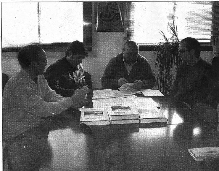
Firma del contrato entre Adir-Iberkeltia y la empresa Sistemas de Impresión de Calamocha

Entre las acciones a ejecutar para promocionar Paisa-